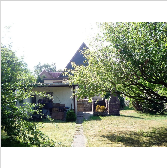
Wohnen im Grünen!

Grundstücksfläche: 758,00 m 2 Kaufpreis: 595.000,00 EUR